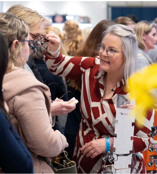
In der Dentalausstellung waren 124 Aussteller vertreten