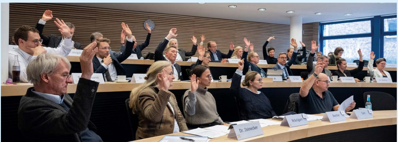
Große Einigkeit bei den Anträgen: Die Delegierten verabschiedeten vier politische Beschlüsse

Aus den Mitteln des Strukturfonds sollen unter anderem die Strukturen des Notfallbereitschaftsdienstes gefördert werden. Auch die Absolvierung der Famulatur nach § 15 ZApprO in schleswig-holsteinischen Zahnarztpraxen, die in Planungsbereichen mit einem Versorgungsgrad von unter 100% liegen, soll gefördert werden.