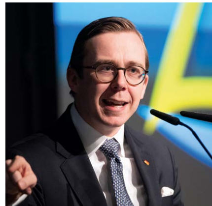
Philipp Amthor kündigte „Bürokratierückbau, bessere Rechtsetzung, mehr Qualität der Gesetze und mehr Einbeziehung der Praxis“ an

Philipp Amthor , parlamentarischer Staatssekretär beim Bundesminister für Digitales und Staatsmodernisierung, sagte im Festvortrag zum Thema „Transformation zu einem modernen, effizienten und digital handlungsfähigen Staat“, dass sich Deutschland zuletzt „verknottet“ habe. Der Staat sei zu langsam und kompliziert geworden. „Wir sorgen dafür, dass Deutschland wieder schneller wird“, kündigte der