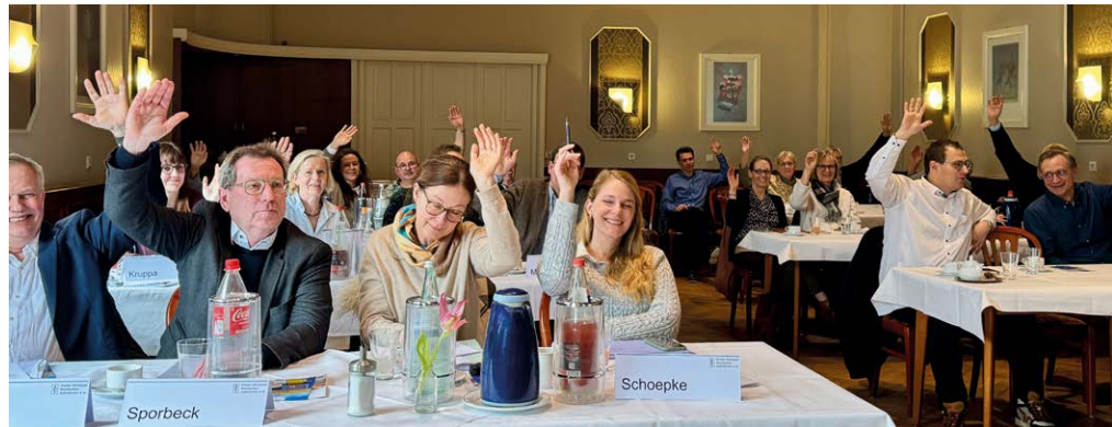
Große Einigkeit der Delegierten nach konstruktiver Debatte.

Nach intensiver Debatte wurden sämtliche vom Landesvorstand eingebrachten Anträge ohne Gegenstimmen verabschiedet. In einer Resolution fordern die Delegierten unter anderem von der Bundesregierung, endlich den Fuß von der „Reformbremse“ zu nehmen: Der immer wieder versprochene Bürokratieabbau müsse umgesetzt und der Mut zur Selbstständigkeit gefördert werden; die Rentenversicherung müsse durch Anpassung der Altersgren-